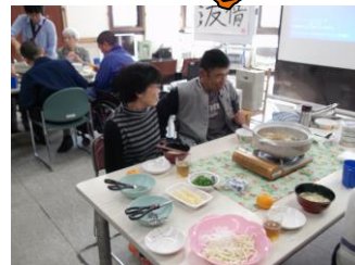
1月3日の食事会は鍋。ご家族参加の企画にし、大変会話がはずみました。