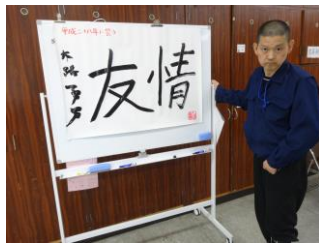
書き初めです。男らしい迷いのない線で書いてくれました。