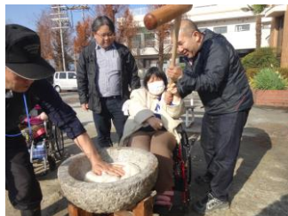
年末恒例のもちつき。地域の人やご家族も手伝いに来てくれます。