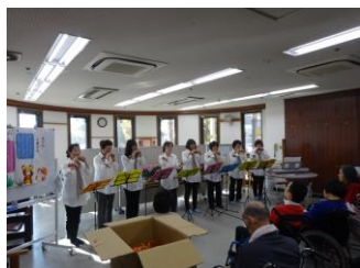
12月5日オカリナサークルによる演奏会がありました。