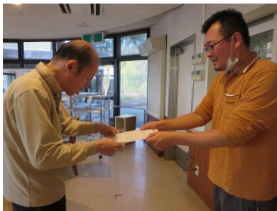
▲賞状をもらうDさん

祝日余暇では、コイン入れゲーム、的当てを行いました。コイン入れゲームは、水中の容器に向かってコインを入れるシンプルなゲームで、得点に応じて表彰もあり盛り上がりました。