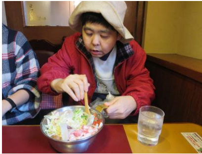
▲ソース、マヨネーズ、たっぷり自分でかけて食べました