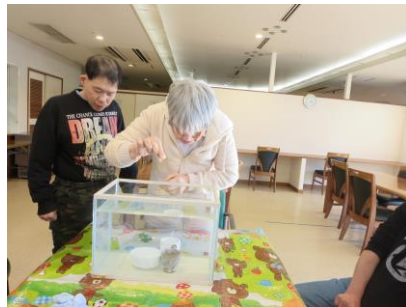
▲狙いを定めてコインを落します

祝日余暇では、コイン入れゲーム、的当てを行いました。コイン入れゲームは、水中の容器に向かってコインを入れるシンプルなゲームで、得点に応じて表彰もあり盛り上がりました。