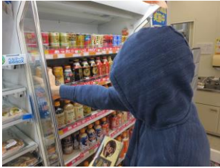
▲コーヒーを選んでいきます