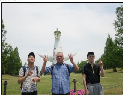
▲太陽の塔の前で、集合写真