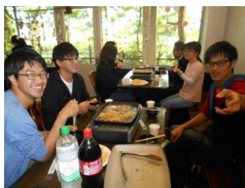
▲そば飯とちゃんちゃん焼き

五月八日には法人全体で新人研修が行われました。研修後には懇親会が開催され、新人職員と先輩職員との交流が行われました。音楽を聴きながら、会話と食事を楽しみました。