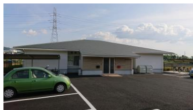
▲「ふじさかてらす」の外観

五月一日に、グループホーム「ふじさかてらす」が開所しました。ふじさかてらすは男性5名、女性5名のユニットに分かれています。さらに各ユニットを仕切りで区切ることが出来るようになっており、少人数の暮らしが実現できると共に、利用者さん自身のペースで生活できるようにになっています。ネーミングには、地域(藤阪)を照らす、という意味も込められています。