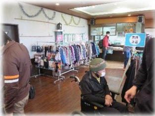
▲実際の会場の様子です

並べられた衣類やお菓子に、利用者さんは大興奮。自分のお気に入りの一着を見つけて、とても満足そうでした。今後三か月に一回程度のペースを目途に実施していく予定です。