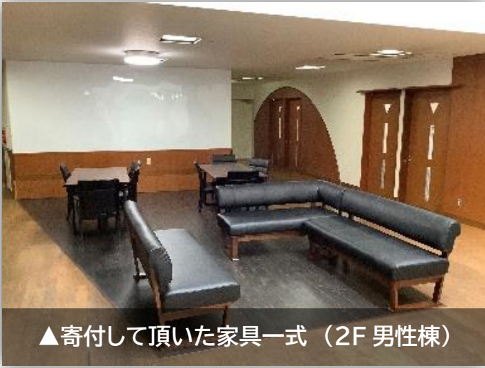
▲寄付して頂いた家具一式 (2F 男性棟)