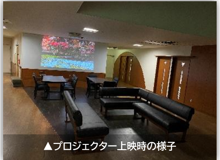
▲プロジェクター上映時の様子

家族会の皆様、新年明けましておめでとうございます。本年も、どうぞよろしくお願いたします。