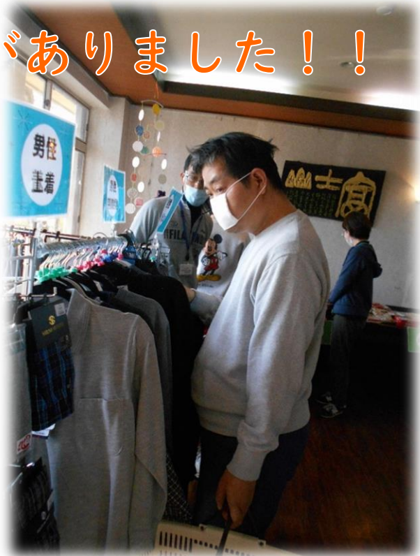
▶実際の会場の様子です