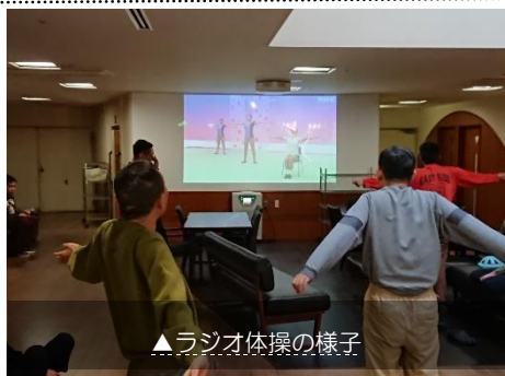
▲ラジオ体操の様子