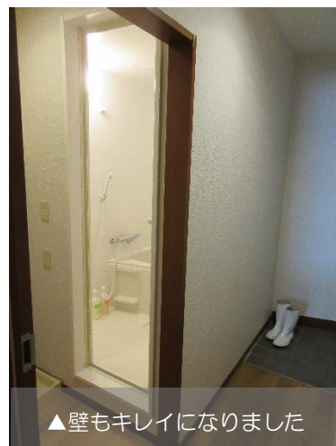
▲壁もキレイになりました