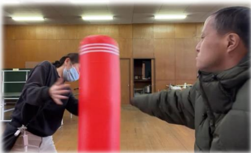
▲こちらはボクシングを楽しむ利用者さん。 リズムに合わせてパンチします。