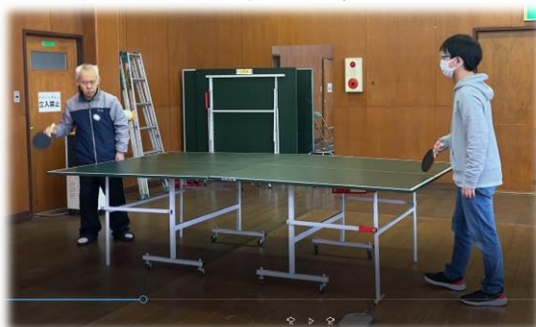
▼とても卓球が上手な利用者さんです。 ずっとラリーが続きます。

毎週土曜日にクラブ活動が始まりました。フライングディスク、ボクシング、卓球、バッティングなど、利用者さんが思い思いに体を動かすことができる時間です。