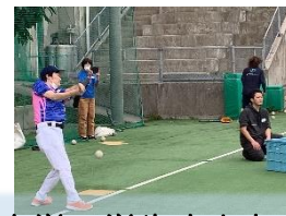
沖縄大学の学生さんと練習&親睦会